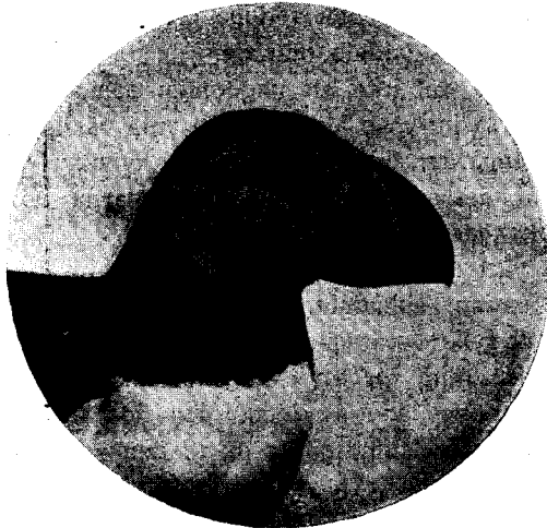
Fratercula arctica Heinäsaaren yleisin lintu.

63. Alca torda L. — Joku määrä pesii kivikkoihin.