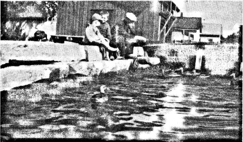
Zahme Wildenten ( Anas p. platyrhyncha ) in der Stadt Ekenäs, Südfinnland.

Emedan i Pojovikens innersta del utfaller ett par åar, därav en utgör avloppet för det betydande vattensystemet i Lojo, går igenom viken ett strömdrag, som på vissa ställen kan vara tämligen starkt. Ett sådant är det smala ställe, över vilket tätt intill Ekenäs stad en järnvägsbro och en landsvägsbro äro uppförda. Under mildare vintrar finnes här alltid öppet vatten och även om sträng köld råder finnas vanligen mindre öppna ställen. Jag erinrar mig att för en tid sedan under tvänne på varandra följande vintrar ett par strömstarar vistades vid stadens ångbåtsbrygga, som ligger rätt nära de nyssnämnda broarna. Till följd av det nämnda strömdraget öppnar sig Ekenäs fjärden tidigt på vårarna och i det öppna vattnet samlar sig ett otal sjöfåglar, vilkas antal under gynnsamma år torde kunna uppgå till något tusental. Huvuddelen av denna talrika invasion utgöres av knipor och gräsänder, ehuru även andra arter äro representerade. Efterhand som isen smälter och det öppna vattnet breder ut sig blir sjöfågelskaran glesare och småningom söka sig fåglarna till andra trakter, som nu redan erbjuda öppet vatten. Såsnart det öppna vattnet närmar sig Ekenäs stads stränder och iskanten befinner sig på några hundra meters avstånd därifrån kan man redan se en eller annan and komma flygande och sätta sig