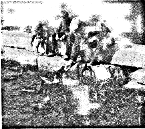
Alt und jung hat grosse Freude von den Enten.

I närheten av Ekenäs häckar och uppehåller sig ett stort antal andra simfåglar än gräsänder. Doppingen är allmän och kan sägas vara halvtam i det att den ofta påträffas nära land i stadens hamnar och är föga skygg. Sothönan, som tidigare icke sågs här, finnes nu tämligen talrikt. Det kan ock antecknas att tofsvipan lär finnas i betydande antal på ett ställe nära Ekenäs — detta enligt uppgift av en fågelkännare. För ornitologer torde Ekenäs med omgivningarna erbjuda åtskilligt av intresse.