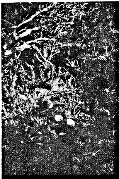
Bo av Asio o. otus med 3 rötägg.

soreus i. infaustus slutet av juni (J. Heinonen) och 15. VII. 25 (G. Hartman). Exemplaret iaktogs på en hög ås beväxt med gammal granskog. Glaucidium p. passerinum (Wegelius) Anas querquedula 1 ex. 12 och 22. VIII. 26, Porzana porzana (Krogerus) samt Larus f. fuscus och Sterna h. hirundo . Dessa longipenner visa sig ofta vid Lehijärvi och andra sjöar, men torde häcka i Vanajavesi.