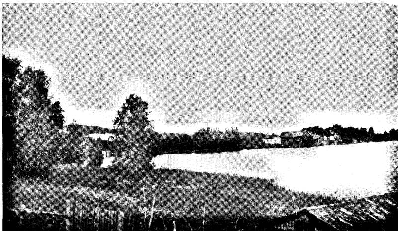
Torkkola by med Armijärvi sjö. Till landskapet hörde Hirundo r. rustica och Delichon u. urbica samt Anas p. platyrhyncha och Podiceps c. cristatus .

Följande förkortningar utvisande häckningsfrekvensen komma att användas: s. a. = synnerligen allmän, a = allmän, m. a. = mindre allmän, s. = sparsam, s. s. = synnerligen sparsam, eventuellt ej längre häckande, samt p. = periodisk, varmed förstås en i ögonen fallande disproportion i häckningsfrekvensen under olika år.