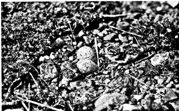
Charadrius hiaticula , ungar och ägg. Aspskärsören 16. VI 29.