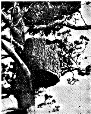
Mergus merganser lämnar holken. Västerbåken 15. VI 29.