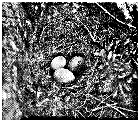
Fiskmåsbö, 2 enfärgade, ljusa ägg. Hamnskär 13. VI 29.

Antalet inemot 1,700 fåglar, som under 4 somardagar antecknades inom Aspskärs skyddsområde och närliggande skär, giver en föreställning om vad trakten kan bjuda fågelvännen. Det arbete till fromma för fågelstammen, som där presteras, är därför värt allt erkännande icke minst med hänsyn till att utbredningsgränsen i Finska viken mot E för flere arter — åtminstone enligt nu känd litteratur — tangerar Aspskärstrakten.